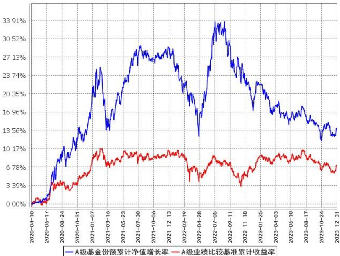
A级基金份额累计净值增长率与同期业绩比较基准收益率的历史走势对比图 (2020年4月10日至2023年12月31日)