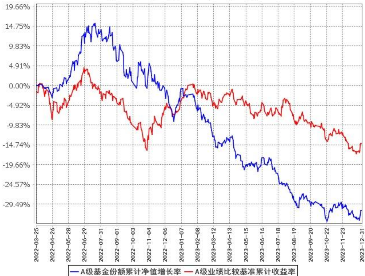
A级基金份额累计净值增长率与同期业绩比较基准收益率的历史走势对比图 (2022年3月25日至2023年12月31日)