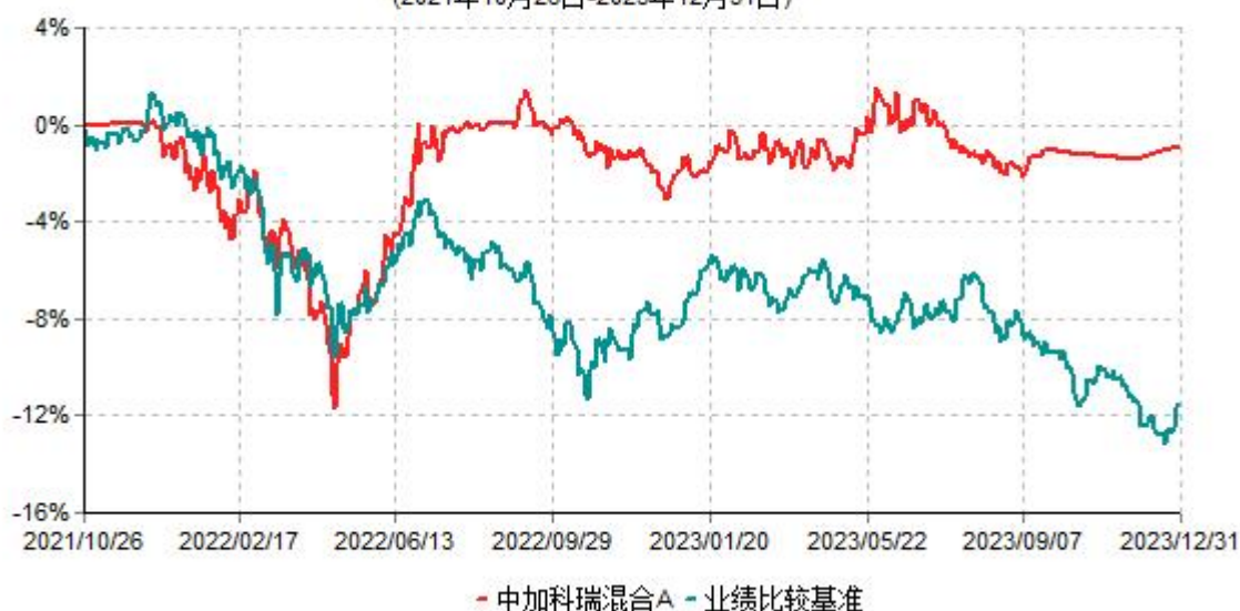
中加科瑞混合A累计净值增长率与业绩比较基准收益率历史走势对比图 (2021年10月26日-2023年12月31日)