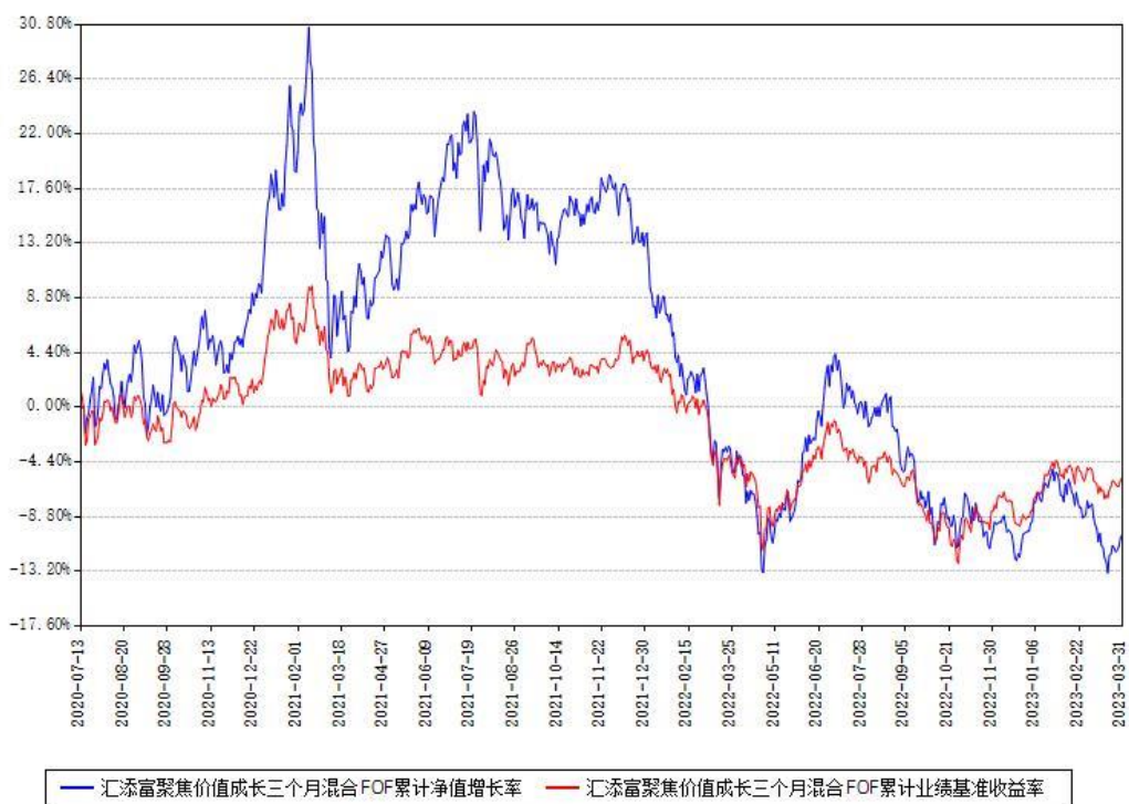
汇添富聚焦价值成长三个月混合FOF累计净值增长率与同期业绩基准收益率对比图