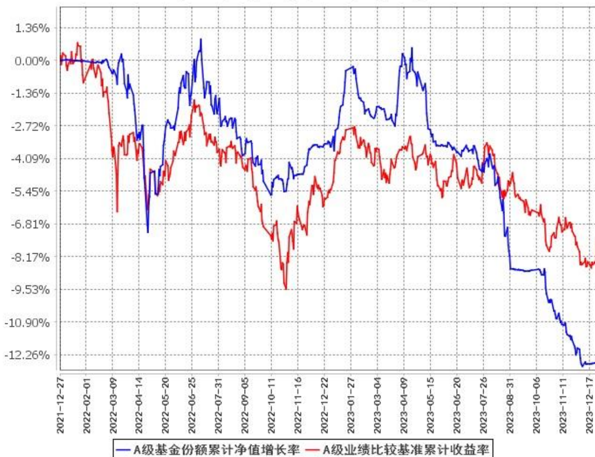
A级基金份额累计净值增长率与同期业绩比较基准收益率的历史走势对比图 (2021年12月27日至2023年12月31日)