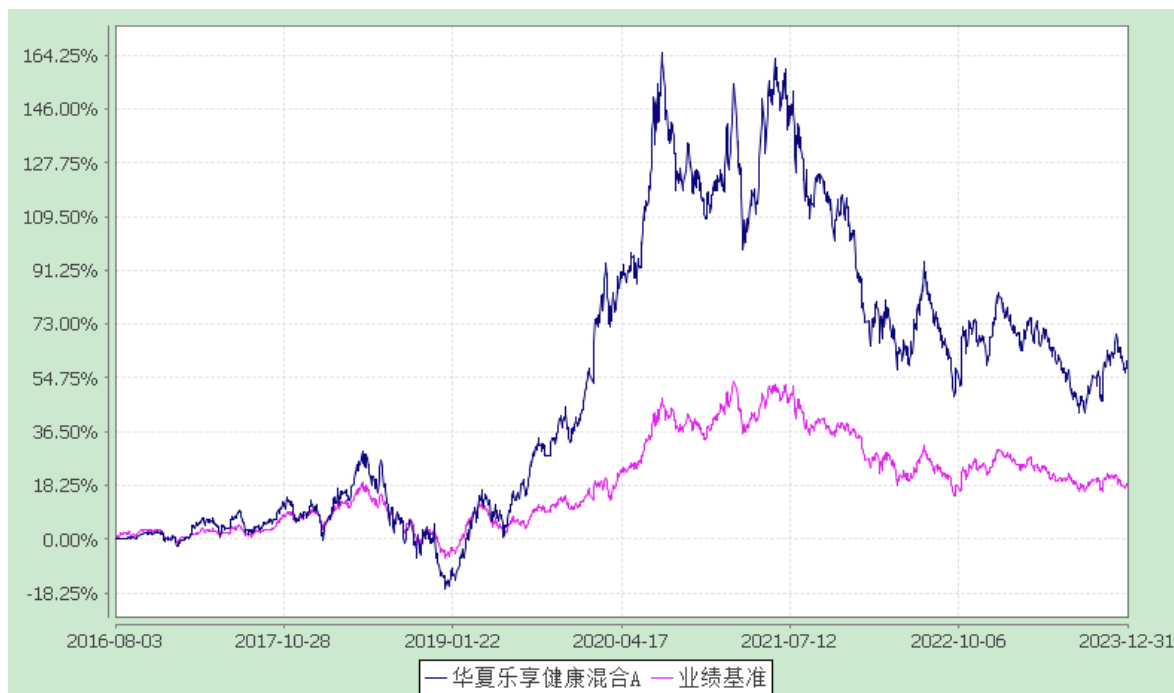
华夏乐享健康混合 C: