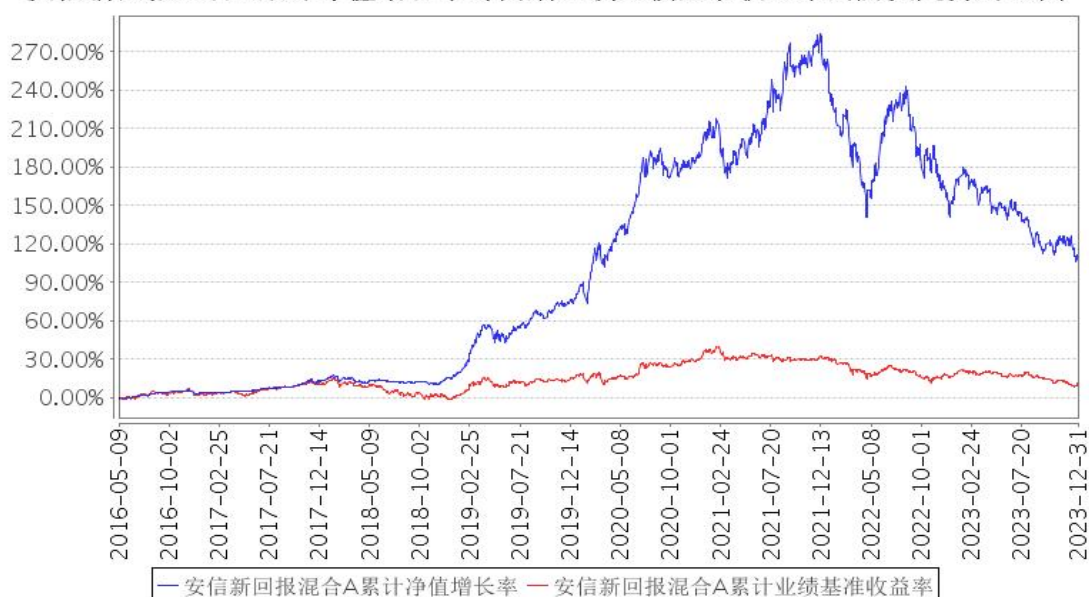
安信新回报混合A累计净值增长率与同期业绩比较基准收益率的历史走势对比图