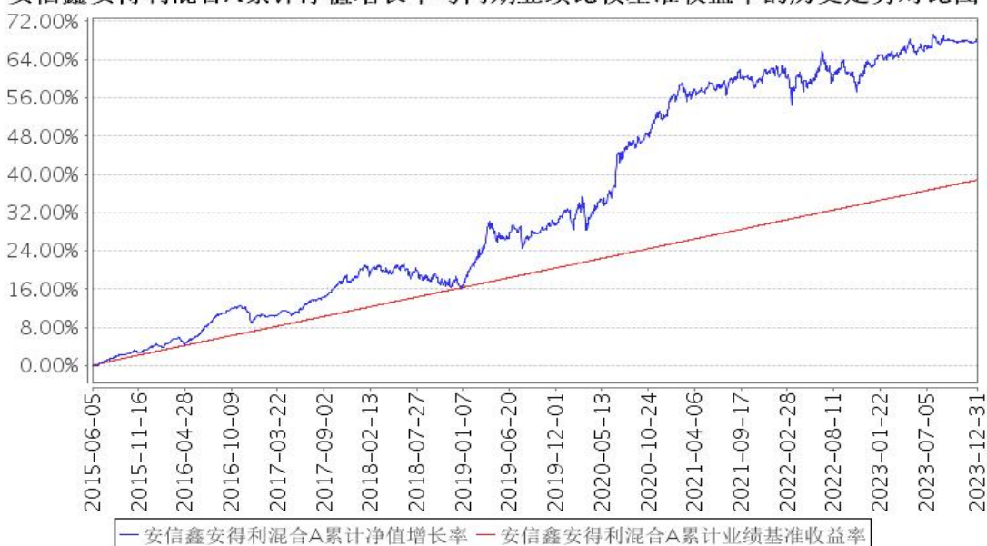
安信鑫安得利混合A累计净值增长率与同期业绩比较基准收益率的历史走势对比图