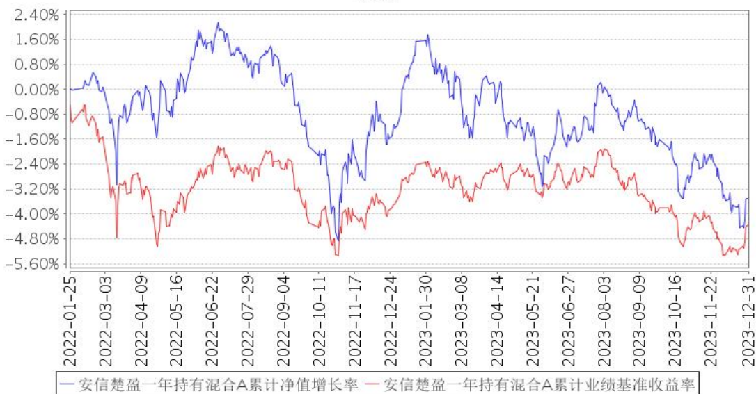
安信楚盈一年持有混合A累计净值增长率与同期业绩比较基准收益率的历史走势对比图