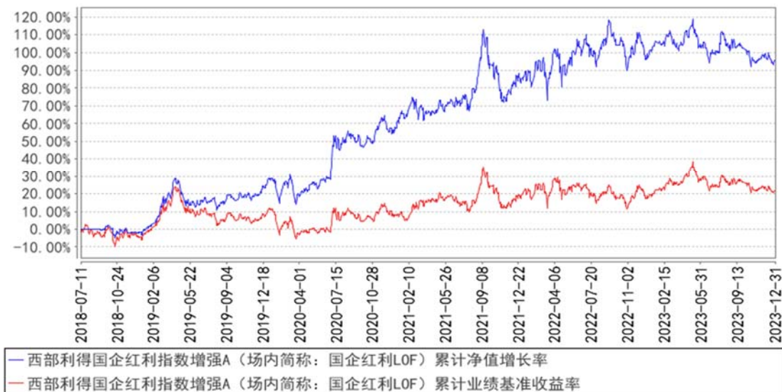
西部利得国企红利指数增强A（场内简称：国企红利LOF）累计净值增长率与同期业绩比较基准收益率的历史走势对比图