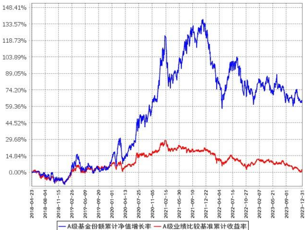
A级基金份额累计净值增长率与同期业绩比较基准收益率的历史走势对比图 (2018年4月23日至2023年12月31日)