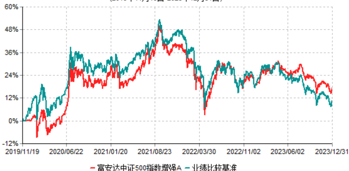
富安达中证500指数增强A累计净值增长率与业绩比较基准收益率历史走势对比图 (2019年11月19日-2023年12月31日)