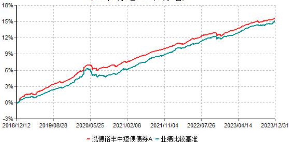
泓德裕丰中短债债券A累计净值增长率与业绩比较基准收益率历史走势对比图 (2018年12月12日-2023年12月31日)