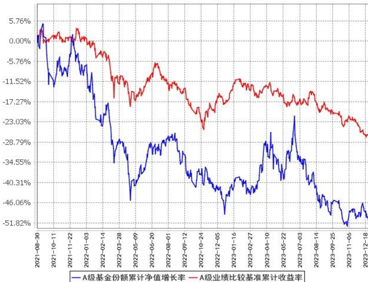
A级基金份额累计净值增长率与同期业绩比较基准收益率的历史走势对比图 (2021年8月30日至2023年12月31日)