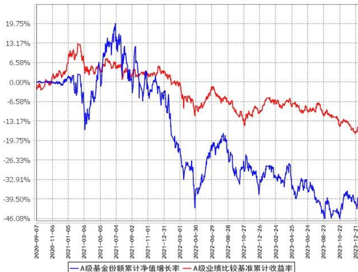
A级基金份额累计净值增长率与同期业绩比较基准收益率的历史走势对比图 (2020年9月7日至2023年12月31日)