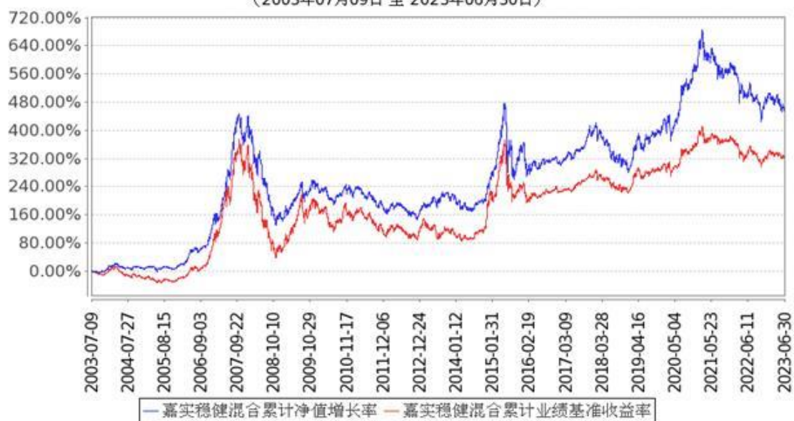
图：嘉实稳健混合份额累计净值增长率与同期业绩比较基准收益率的历史走势对比图