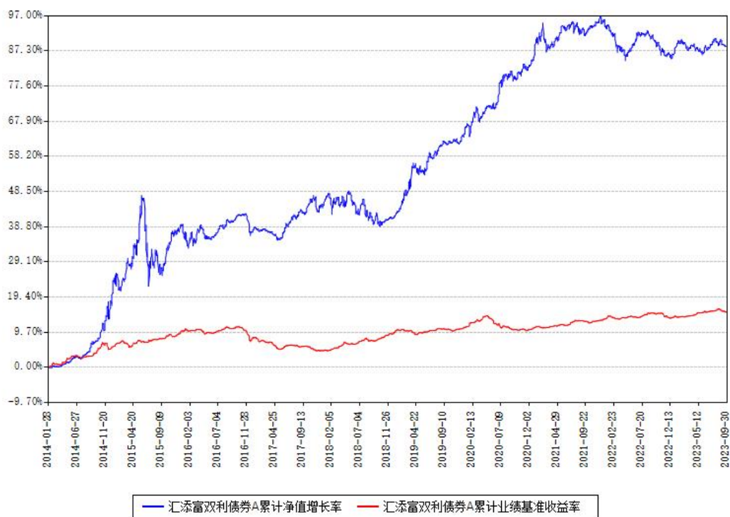
汇添富双利债券A累计净值增长率与同期业绩基准收益率对比图