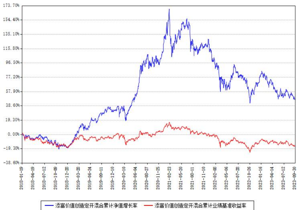
添富价值创造定开混合累计净值增长率与同期业绩基准收益率对比图