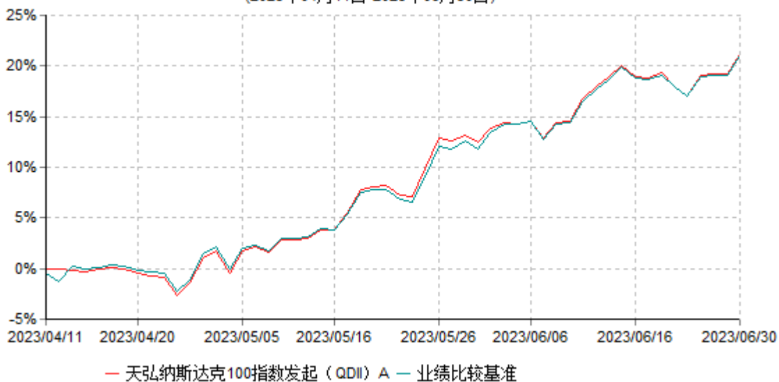
天弘纳斯达克100指数发起（QDII）A累计净值增长率与业绩比较基准收益率历史走势对比图 (2023年04月11日-2023年06月30日)