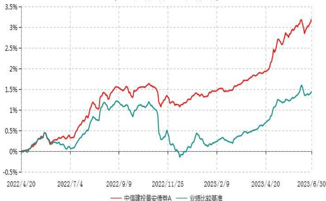
中信建投景安债券A累计净值增长率与业绩比较基准收益率历史走势对比图 (2022年04月20日-2023年06月30日)