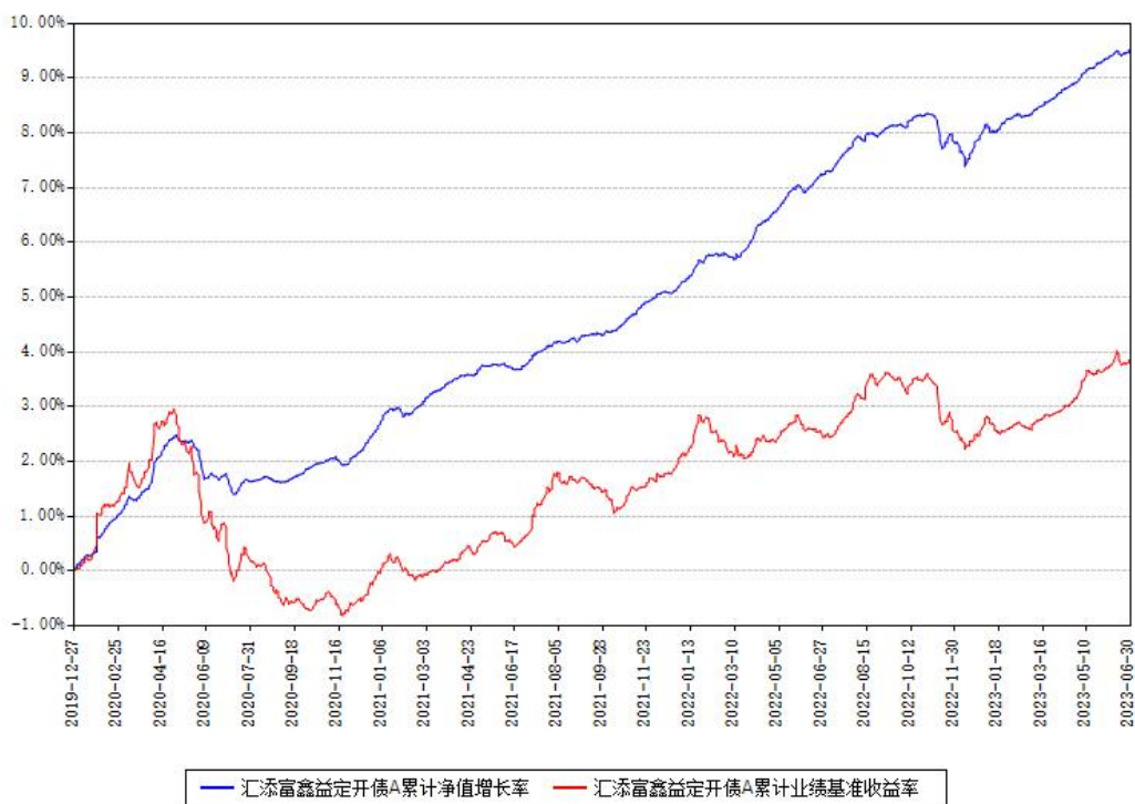
汇添富鑫益定开债A累计净值增长率与同期业绩基准收益率对比图