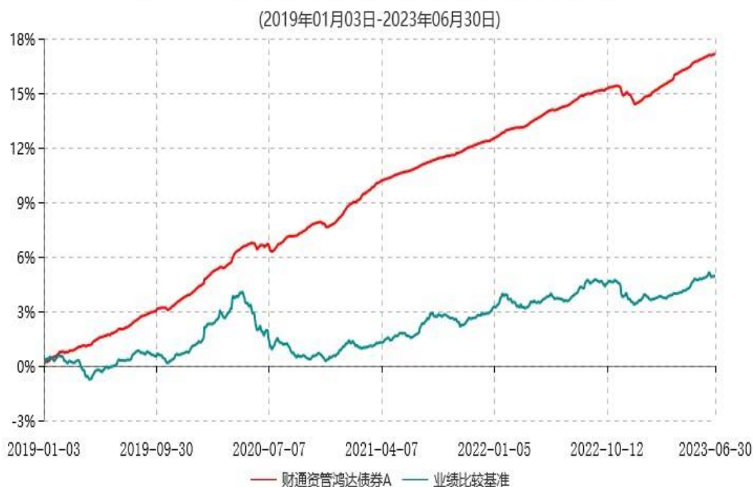
财通资管鸿达债券A累计净值增长率与业绩比较基准收益率历史走势对比图