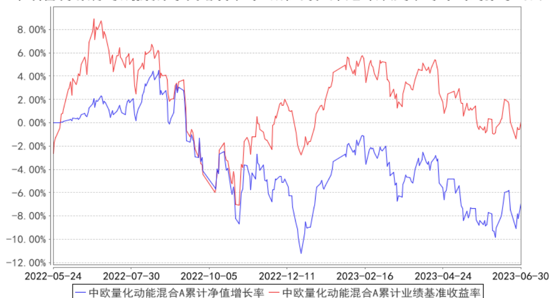
中欧量化动能混合A累计净值增长率与同期业绩比较基准收益率的历史走势对比图

注：本基金基金合同生效日期为 2022 年 5 月 24 日，按基金合同的规定，本基金自基金合同生效起六个月为建仓期，建仓期结束时各项资产配置比例已符合基金合同约定。