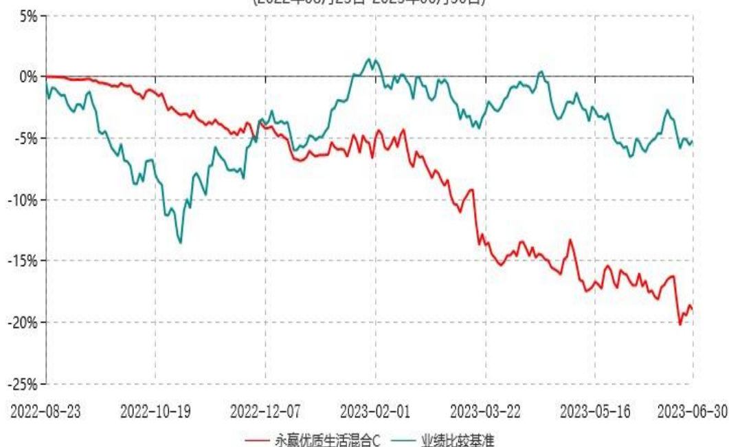
永赢优质生活混合C累计净值增长率与业绩比较基准收益率历史走势对比图 (2022年08月23日-2023年06月30日)

注：1、本基金合同生效日为2022年8月23日，截至本报告期末本基金合同生效未满一年； 2、本基金在六个月建仓期结束时，各项资产配置比例符合合同约定。