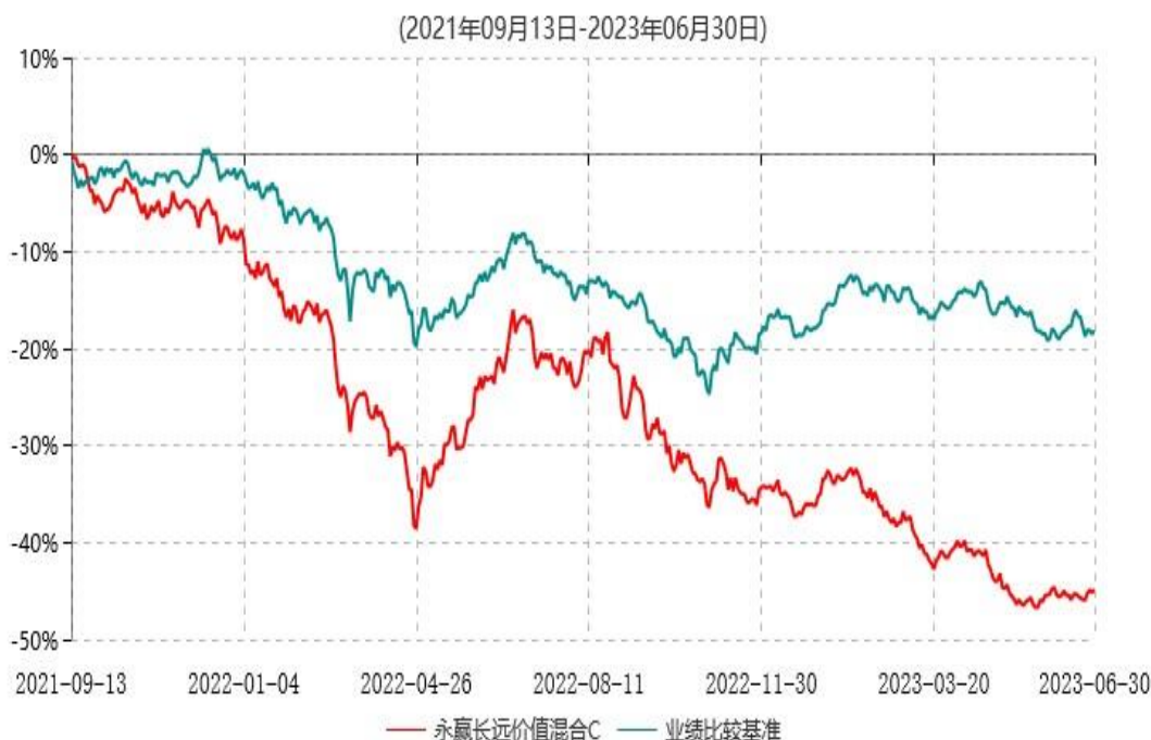
永赢长远价值混合C累计净值增长率与业绩比较基准收益率历史走势对比图