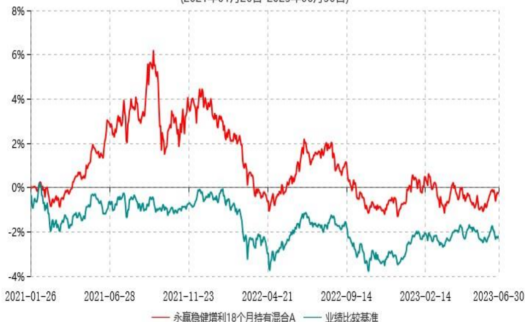
永赢稳健增利18个月持有混合A累计净值增长率与业绩比较基准收益率历史走势对比图 (2021年01月26日-2023年06月30日)