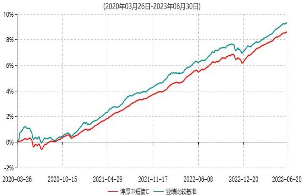
淳厚中短债C累计净值增长率与业绩比较基准收益率历史走势对比图

注：本基金基金合同生效日为 2020 年 3 月 26 日。按基金合同约定，本基金自基金合同生效起 6 个月内为建仓期。建仓期结束时本基金的各项投资比例均符合基金合同约定。