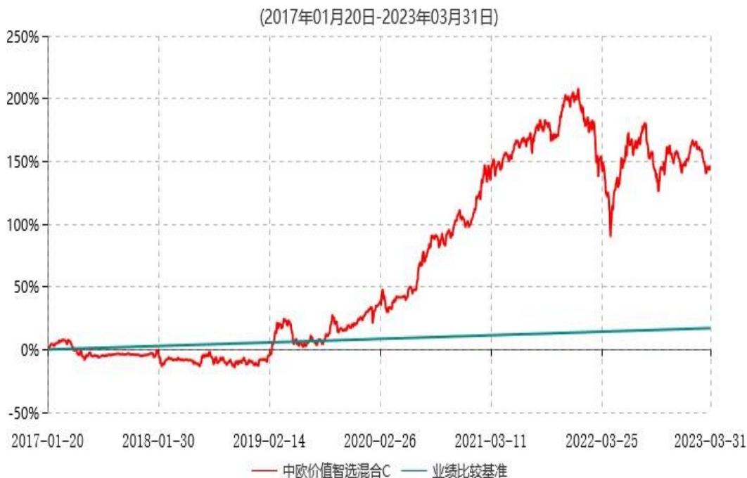
中欧价值智选混合C累计净值增长率与业绩比较基准收益率历史走势对比图

注：本基金自 2017 年 1 月 19 日起增加 C 份额，图示为 2017 年 1 月 20 日至 2023 年 03 月 31 日。