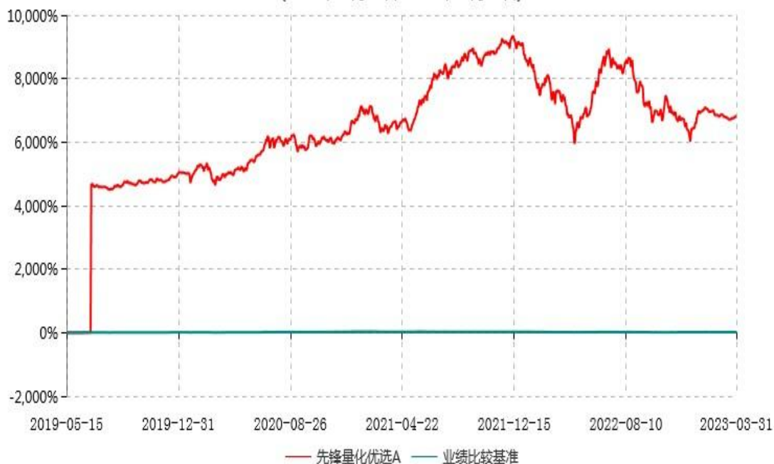
先锋量化优选A累计净值增长率与业绩比较基准收益率历史走势对比图 (2019年05月15日-2023年03月31日)