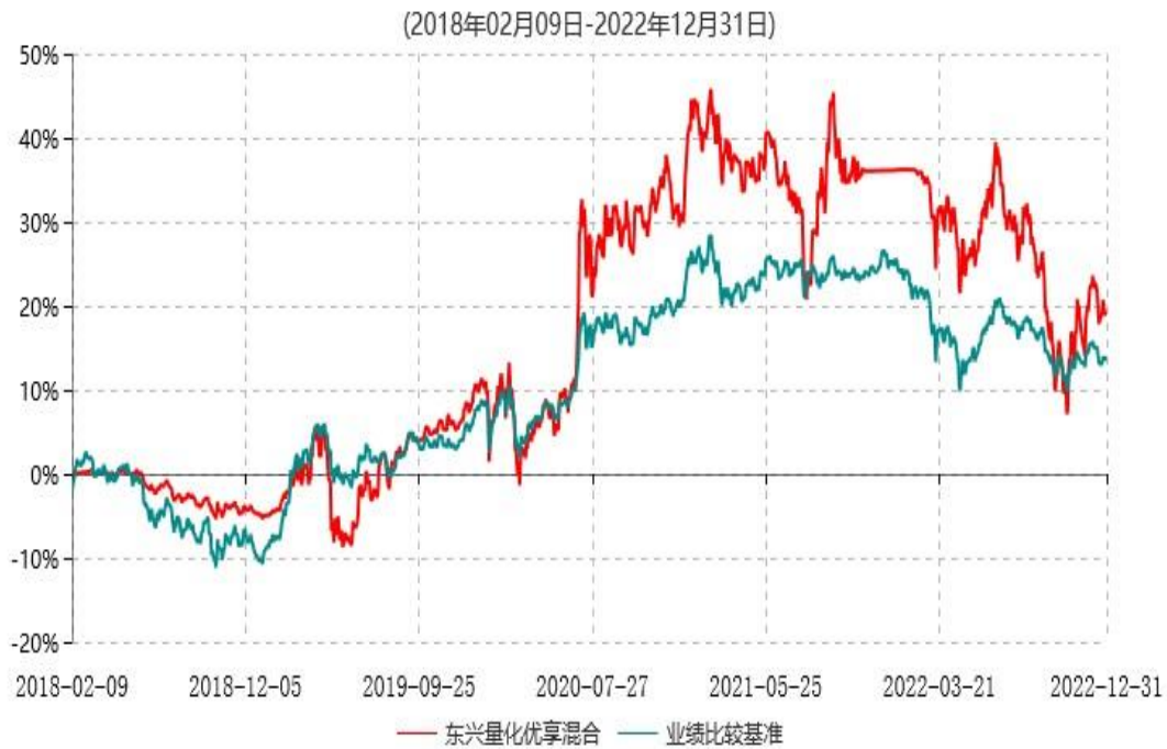
东兴量化优享灵活配置混合型证券投资基金累计净值增长率与业绩比较基准收益率历史走势对比图