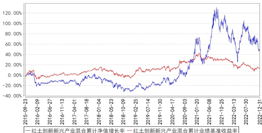
红土创新新兴产业混合累计净值增长率与同期业绩比较基准收益率的历史走势对比图