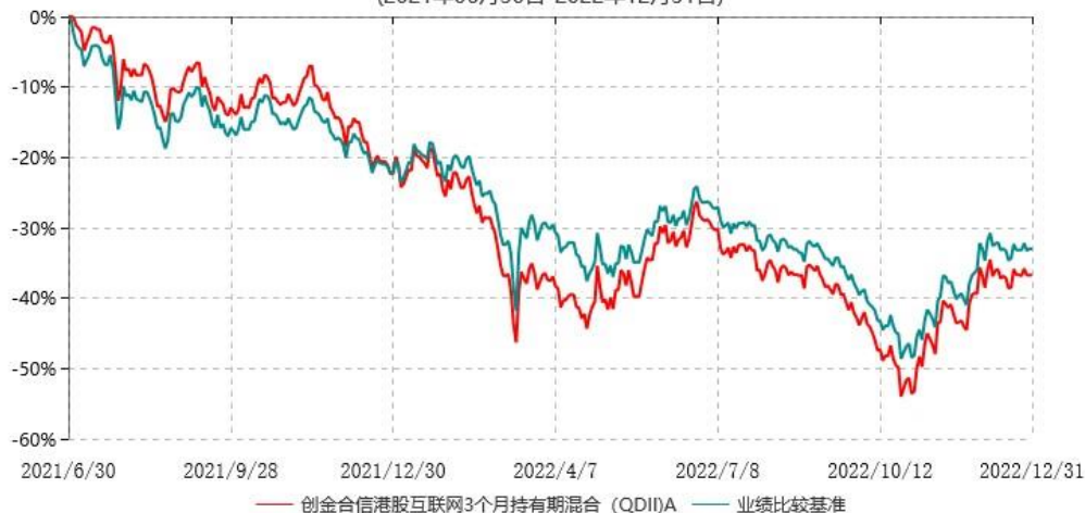
创金合信港股互联网3个月持有期混合（QDII）A累计净值增长率与业绩比较基准收益率历史走势对比图 (2021年06月30日-2022年12月31日)