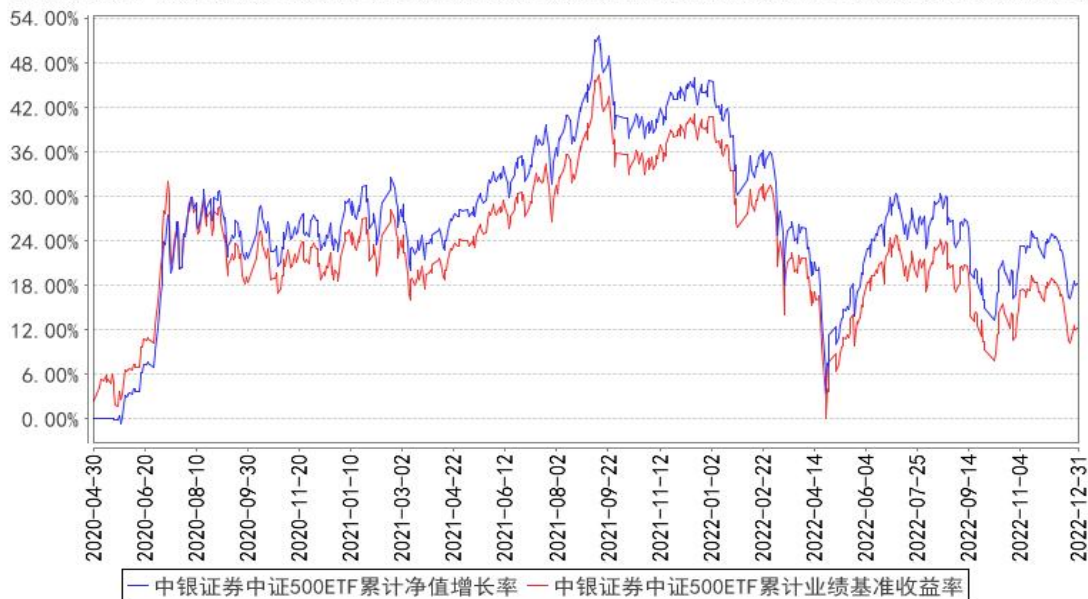
中银证券中证500ETF累计净值增长率与同期业绩比较基准收益率的历史走势对比图