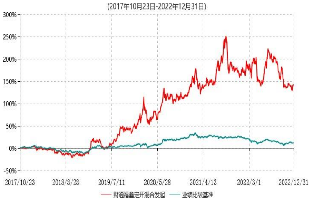
财通多策略福鑫定期开放灵活配置混合型发起式证券投资基金累计净值增长率与业绩比较基准收益率历史走势对比图