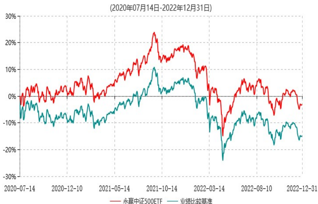
永赢中证500交易型开放式指数证券投资基金累计净值增长率与业绩比较基准收益率历史走势对比图