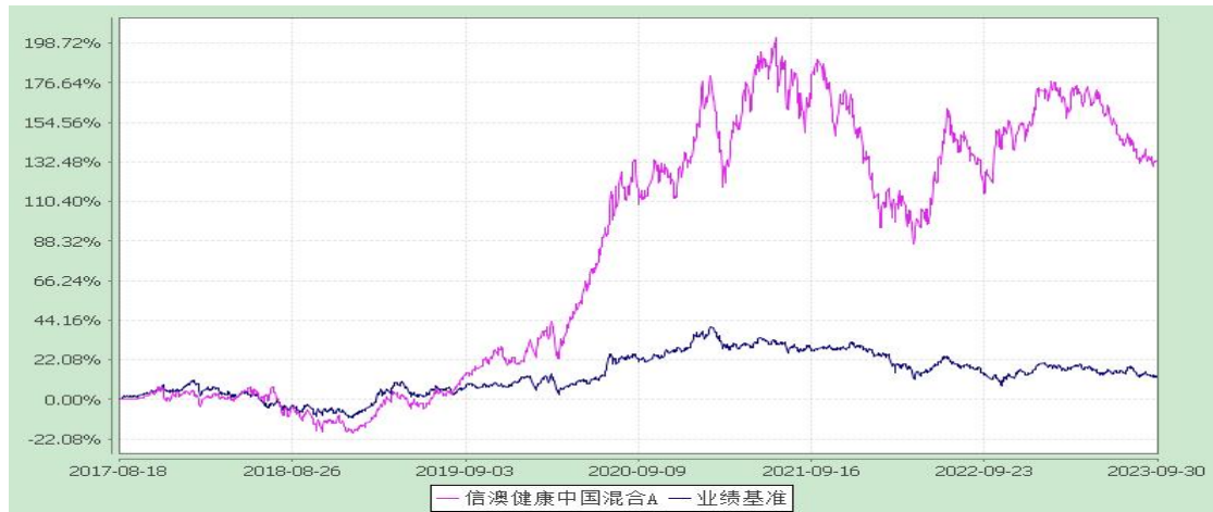
信澳健康中国混合 C 累计净值增长率与业绩比较基准收益率的历史走势对比图