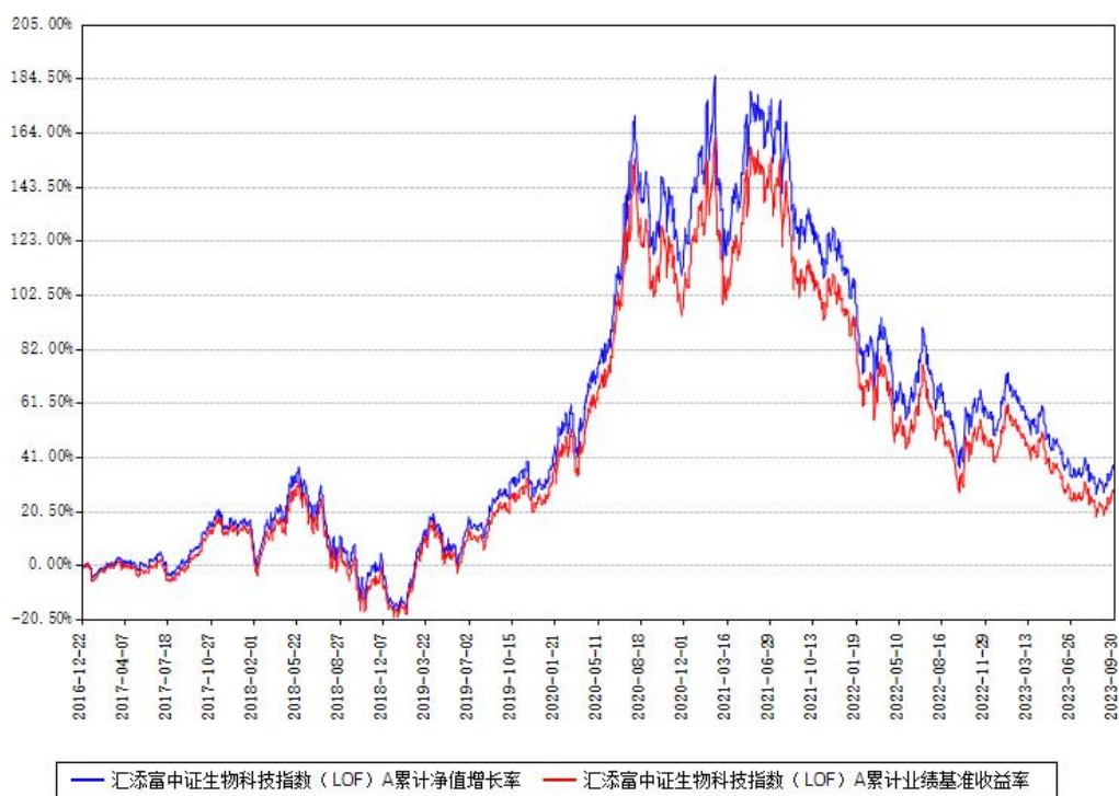
汇添富中证生物科技指数（LOF）A累计净值增长率与同期业绩基准收益率对比图

(二) 自基金合同生效以来基金累计净值增长率变动及其与同期业绩比较基准收益率变动的比较图