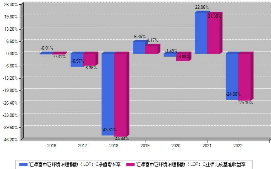
汇添富中证环境治理指数 (LOF) C 每年净值增长率与同期业绩基准收益率对比图

注：基金的过往业绩不代表未来表现。本《基金合同》生效之日为2016年12月29日，合同生效当年按实际存续期计算，不按整个自然年度进行折算。