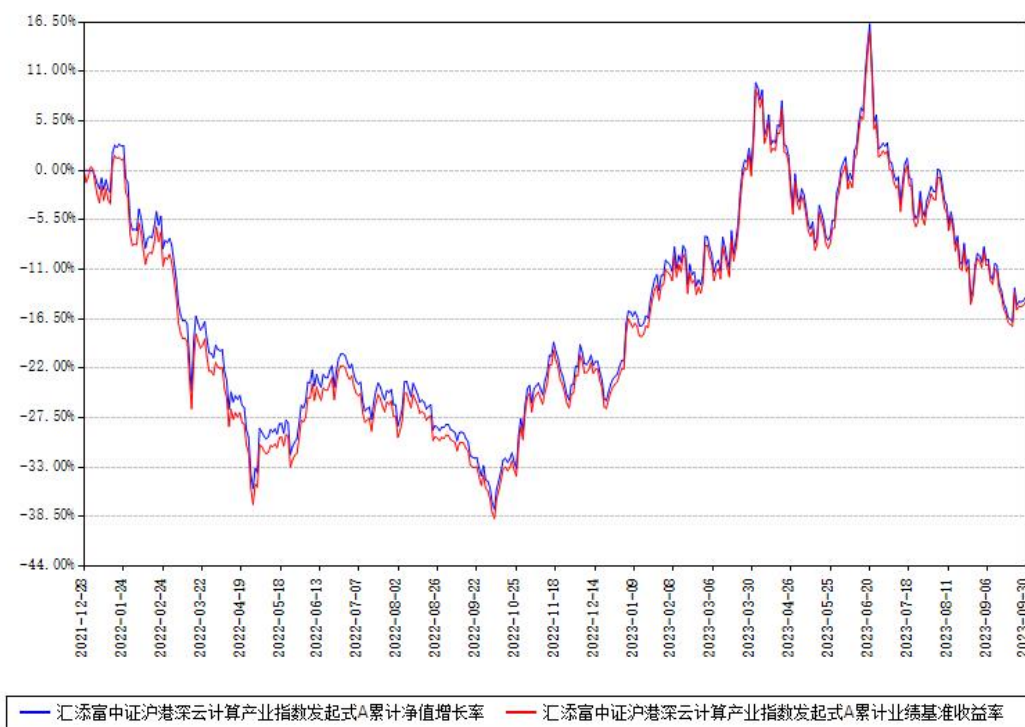
汇添富中证沪港深云计算产业指数发起式A累计净值增长率与同期业绩比较基准收益率对比图

（二）自基金合同生效以来基金累计净值增长率变动及其与同期业绩比较基准收益率变动的比较图