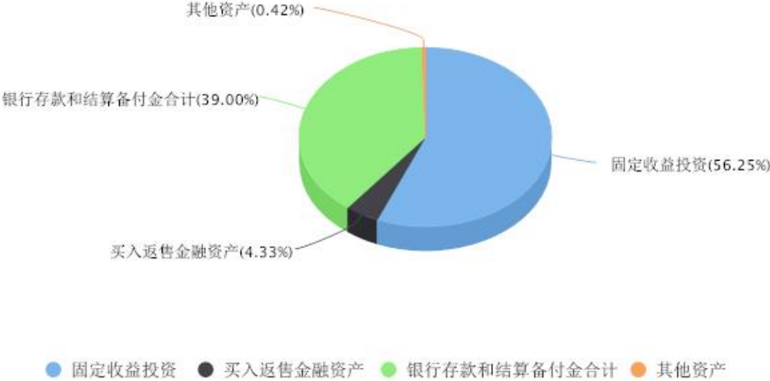
投资组合资产配置图表 数据截止日期:2023年09月30日