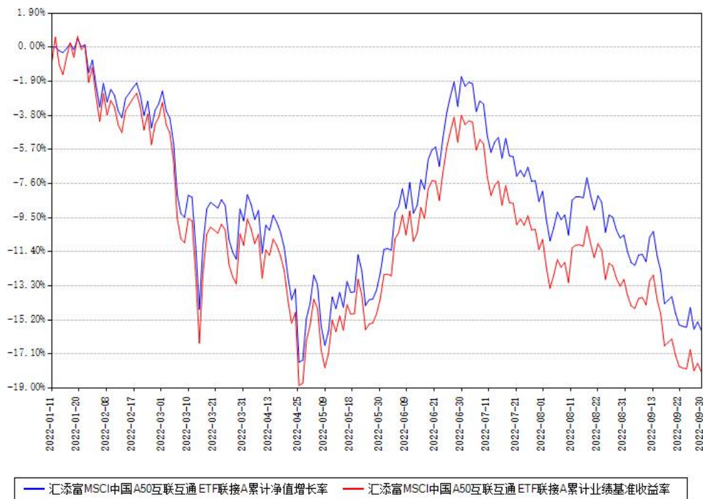
汇添富MSCI中国A50互联互通ETF联接A累计净值增长率与同期业绩基准收益率对比图