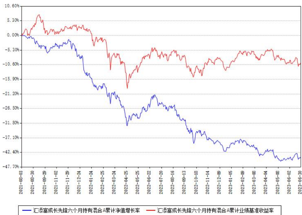
汇添富成长先锋六个月持有混合A累计净值增长率与同期业绩基准收益率对比图