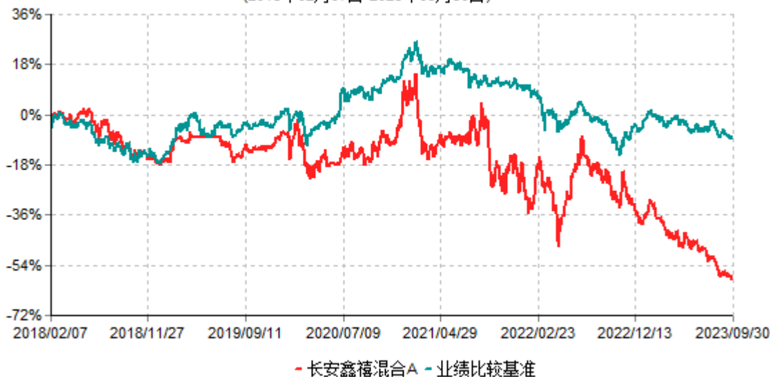
长安鑫禧混合A累计净值增长率与业绩比较基准收益率历史走势对比图 (2018年02月07日-2023年09月30日)