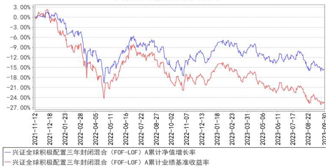
兴证全球积极配置三年封闭混合（FOF-LOF）A 累计净值增长率与同期业绩比较基准收益率的历史走势对比图