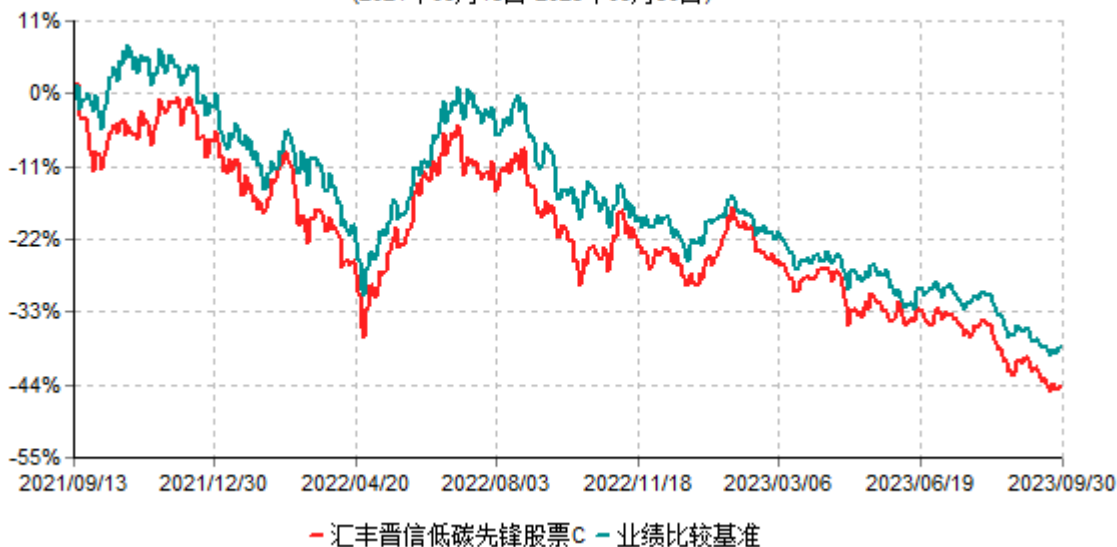
汇丰晋信低碳先锋股票C累计净值增长率与业绩比较基准收益率历史走势对比图 (2021年09月13日-2023年09月30日)