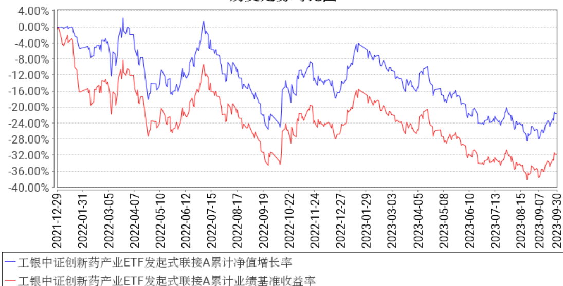
工银中证创新药产业ETF发起式联接A累计净值增长率与同期业绩比较基准收益率的历史走势对比图