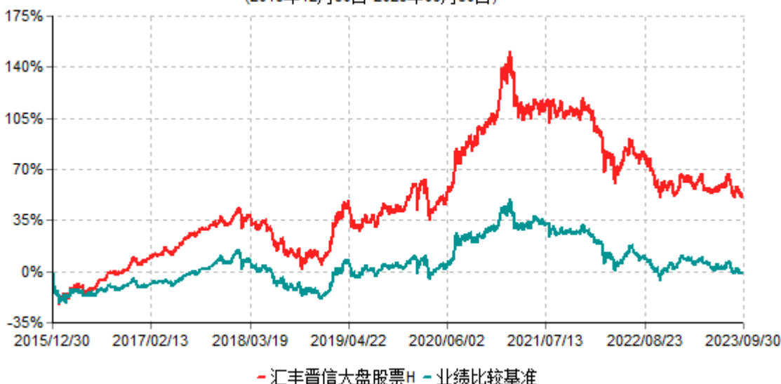
汇丰晋信大盘股票H累计净值增长率与业绩比较基准收益率历史走势对比图 (2015年12月30日-2023年09月30日)

注：1. 按照基金合同的约定，本基金的股票投资比例范围为基金资产的 85%-95%，其中，本基金将不低于 80%的股票资产投资于国内 A 股市场上具有盈利持续稳定增长、价值低估、且在各行各业中具有领先地位的大盘蓝筹股票。本基金固定收益类证券和现金投资比例范围为基金资产的 5%-15%，其中现金（不包括结算备付金、存出保证金、应收申购款等）或到期日在一年以内的政府债券的投资比例不低于基金资产净值的 5%。