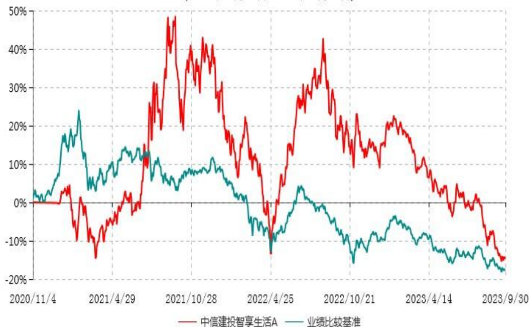
中信建投智享生活A累计净值增长率与业绩比较基准收益率历史走势对比图 (2020年11月04日-2023年09月30日)