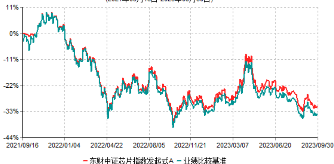
东财中证芯片指数发起式A累计净值增长率与业绩比较基准收益率历史走势对比图 (2021年09月16日-2023年09月30日)