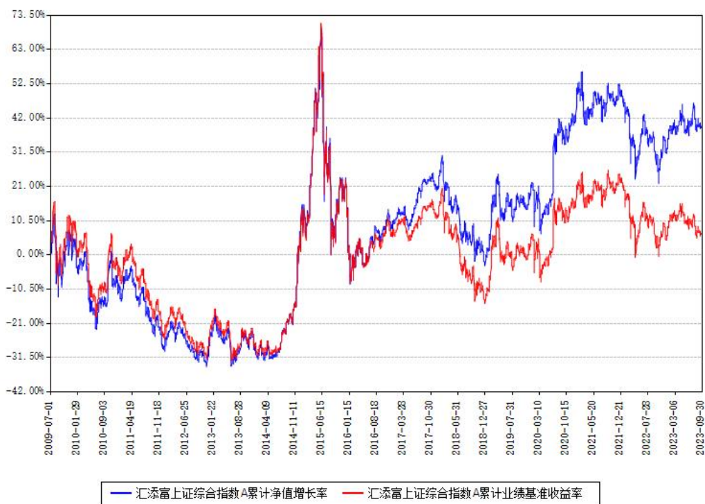
汇添富上证综合指数A累计净值增长率与同期业绩基准收益率对比图